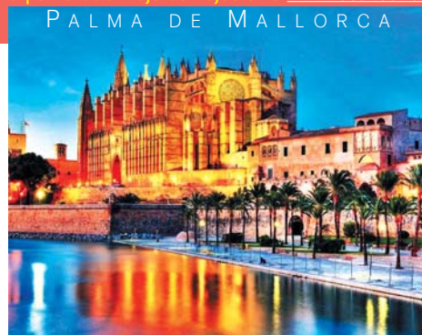
PALMA DE MALLORCA

9. den: Snídaně, pobyt u moře, individuální volno, večere. Od července fakultativně večerní návštěva Palmy spojená s panoramatickou projíždkou lodí kolem nasvíceného města a proslulého přístavu. 10. den: Snídaně, celodenní výlet s nezapomenutelným cestováním po nejhezčích přírodních místech severozápadní části ostrova. Z Palmy se vydáte historickým vlakem na 50minutovou cestu do Solleru, půvabného městečka ukrytého v údolí pohoří Tramuntana, po cestě budete míjet plantáže s pomerančovničky a mandlovníky a projedete řadou tunelů. Ze Solleru sjedete vyhlídkovou tramvaj do malebného přístavu Port Soller, zde nasednete na loď a poplujete do ústí rájského kaňonu Torrent de Pareis. Následuje volný čas ke koupání v moři nebo k procházce soutěskou, ze které ústí do moře dva horské potoky. Po té se proslulou horskou cestou Sa Calobra budete vracet na ubytování. Po cestě zastávka v historické lisovně olivového oleje Tafona de Caimari, kde budete mít možnost prohlédnout si tradiční výrobu i ochutnat výborný místní olej, večere. 11. den: Snídaně, pobyt u moře, individuální volno, večere. Fakultativně výlet na východní pobřeží ostrova, kde se nacházejí unikátní jeskyně, jejichž návštěva je spojená s koncertem klasické hudby na jezeře. Během výletu navštívíte i malebný rybářský přístav Porto Cristo, kde volno