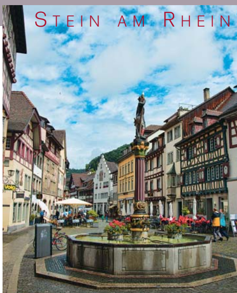
STEIN AM RHEIN

Další širokou nabídku poznávacích zájezdů najdete na www.idealtravel.cz