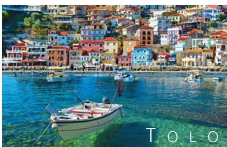
T O L O

6. den: Odjezd na poloostrov Peloponés „kolébka civilizace“. Jak jinak bychom mohli nazvat tuto oblast, kde se nachází tak slavná místa počátku vyspělé společnosti jako Sparta, Mykény, Korint nebo Olympie? Navštívíme archeologický areál starověkého Korintu se zbytky chrámů (Apollónův chrám, Lechaionská cesta, Octavin chrám, Odeion). Epidauros UNESCO - posvátný okrsek boha lékařství Asklépia s největším divadlem v Řecku. Starobylé