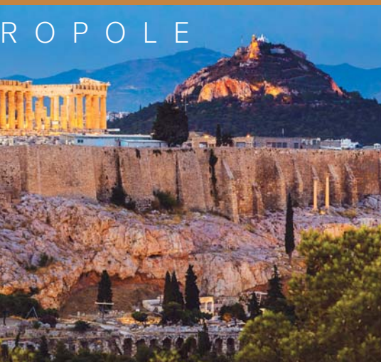
R O P O L E

za pomoci československých odborníků a naši poslední zastávkou bude raně byzantský kostel sv. Nikolaje, který se tyčí na nízké vyvýšenině uprostřed ruin starého kláštera v blízkosti řecké vesničky Mesopotami. Návrat na ubytování, večere.