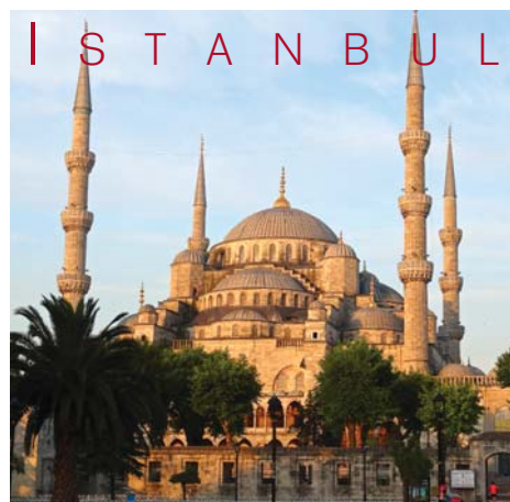
I S T A N B U L