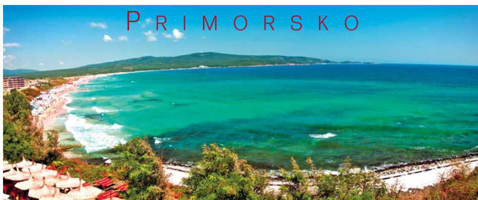
P R I M O R S K O